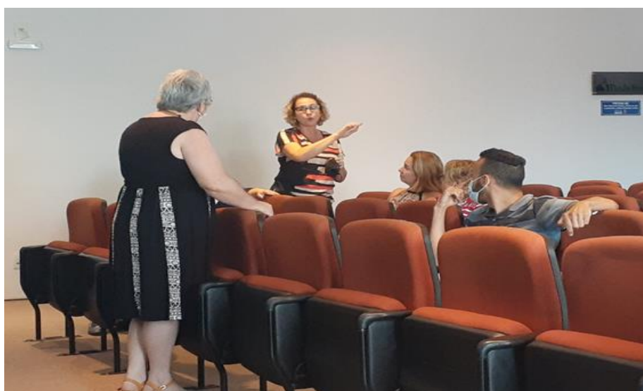
Reunião CME SALTO e Instituições dezembro de 2021

Estas foram as contribuições necessárias para a garantia de oferta de Educação Especial aos alunos da Rede Municipal de Salto/SP.