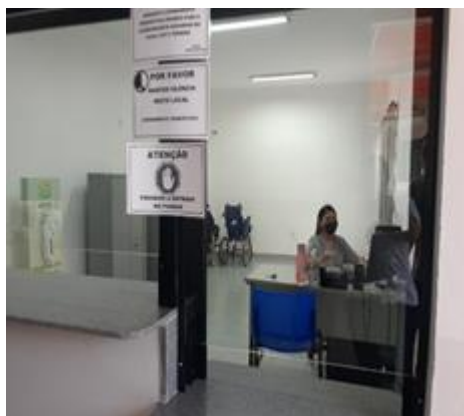
VISITA APAE 2022